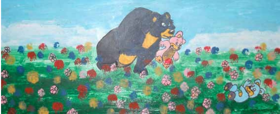
Enzo DENTE (fuori concorso)