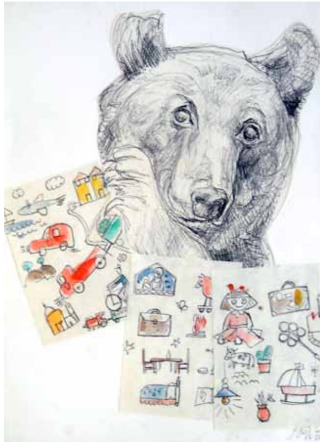
“l'orso e la band”

penna a sfera, collage e acquarello 21x29,5