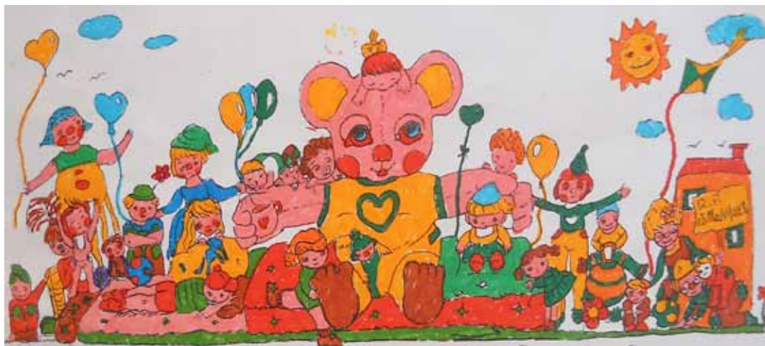
Laura CAMPAGNOLI (disegno) – Nadia LEPRI (colore)