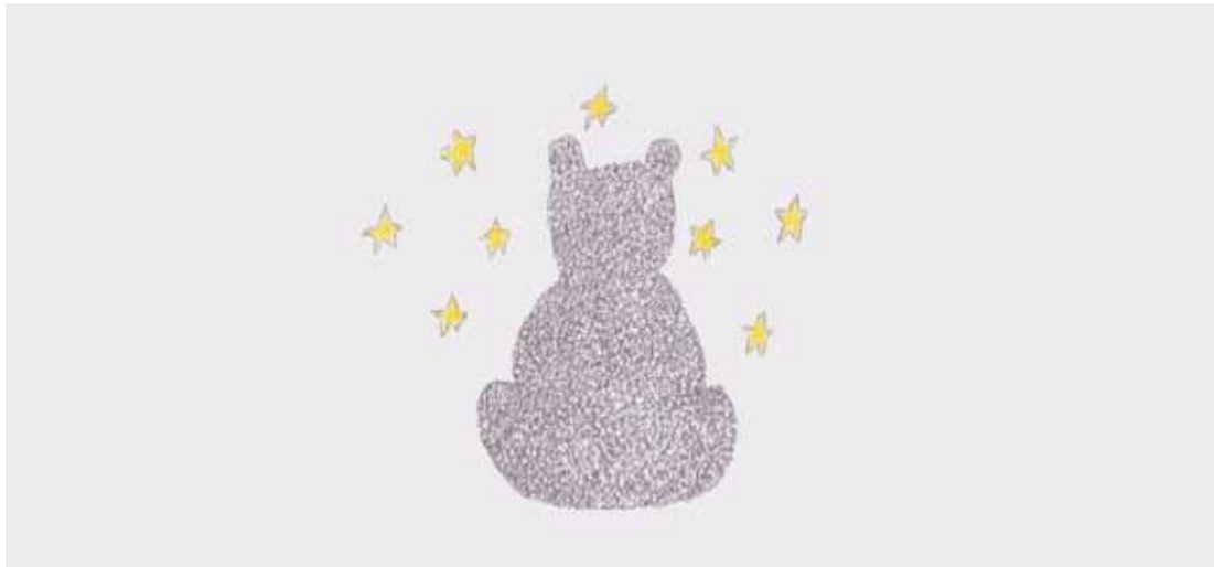
Schiano DI PEPE