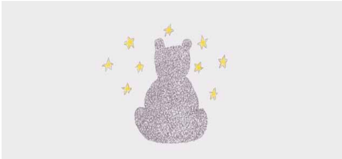
Schiano DI PEPE