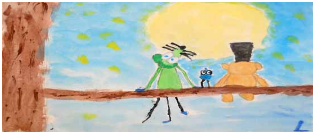
LUCA (5 anni)