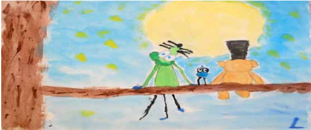
LUCA (5 anni)