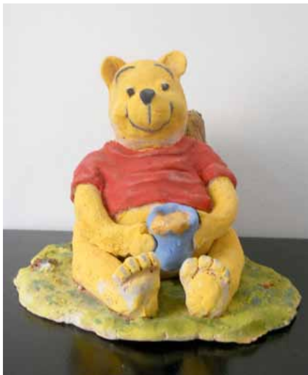
“winnie the pooh”